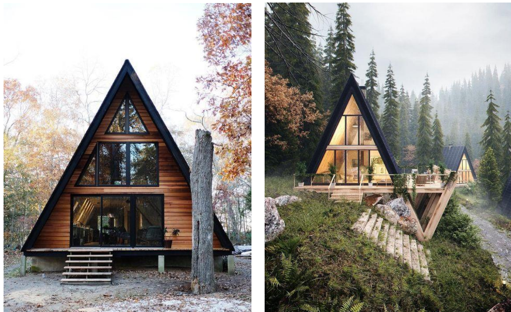
Gambar 3.4 Bangunan Wisata Alam

Gambar 3.3 merupakan salah satu bangunan yang menerapkan bentuk segitiga dan menggunakan material yang memadukan antara kayu dan kaca, sehingga pengguna dapat menikmati pemandangan luar bangunan saat berada di dalamnya. Gambar 3.4 merupakan gambar bangunan yang menyikapi alam sekitar dengan penerapan material kayu dan kaca serta adanya sebuah teras yang terbuka sehingga digunakan untuk bersantai untuk menikmati pemandangan sekitar.