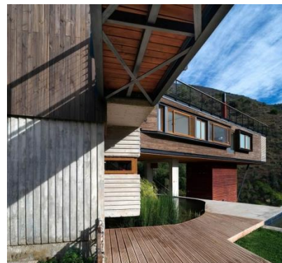
Gambar 3.1 bangunan Casa El Maqui