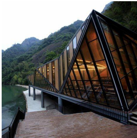
Gambar 3.3 Penerapan Fasade Bangunan

Penggunaan batu alam pada pada lantai bangunan dan dinding yang dibuat lebih terbuka dengan penggunaan kaca sehingga memberi kesan yang natural dan seolah menyatu dengan ruang luar.