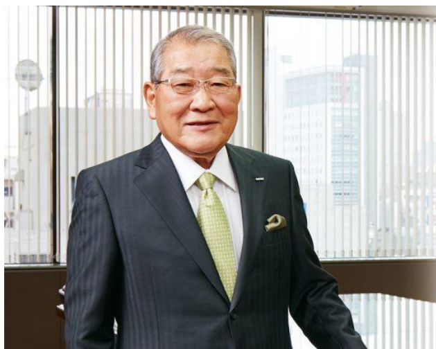
Gambar III.4 Kenzi Tsujimoto

Capcom didirikan oleh Kenzo Tsujimoto, seorang pria keturunan Jepang yang lahir pada 15 Desember 1940, ia merupakan seorang pebisnis yang mendirikan perusahaan video game Irem dan Capcom.