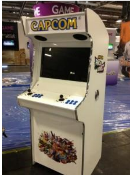
Gambar III.3 Mesin video game arkade ciptaan Capcom

Capcom didirikan oleh Kenzo Tsujimoto, seorang pria keturunan Jepang yang lahir pada 15 Desember 1940, ia merupakan seorang pebisnis yang mendirikan perusahaan video game Irem dan Capcom.