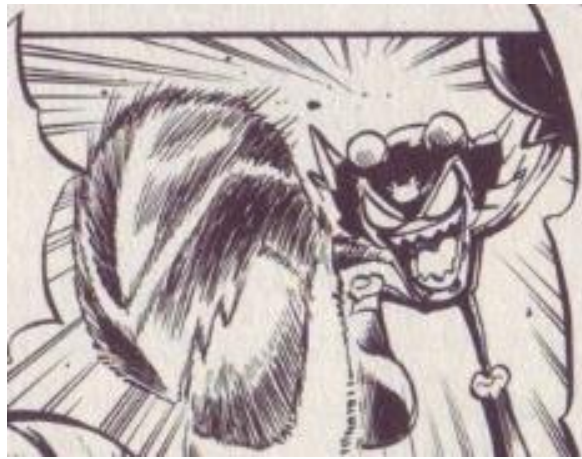
Gambar III.9 Cancer Bubble

Cancer Bubble merupakan salah satu tokoh yang sempat menjadi musuh Rockman. Ia berpura-pura mengagumi Rockman dan ingin menjadi adiknya demi mengelabui dan mengalahkannya. Meskipun Cancer Bubble berpikir dapat mengalahkan Rockman, pada akhirnya ia berhasil dikalahkan oleh Rockman. Setelah Cancer Bubble dikalahkan dan ditolong oleh Rockman, ia tersadar akan kesalahannya kemudian mengagumi Rockman dan benar-benar ingin menjadi adiknya.