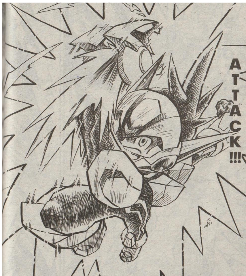
Gambar III.6 Rockman

Sumber: Komik Rockman The Shooting Star volume tiga, halaman 54