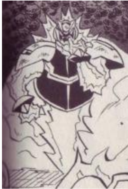
Gambar III.8 Warlock