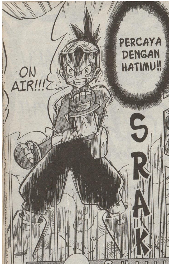
Gambar III.7 Subaru Hoshikawa

Subaru Hoshikawa memiliki postur seorang anak laki-laki yang kurus dan memiliki tinggi badan yang sedang. Ia memiliki mata yang besar, rambut berbentuk runcing dan mencuat pada bagian belakangnya. Pada kepalanya ia mengenakan kacamata khusus yang membuatnya dapat melihat alien dan dunia gelombang.