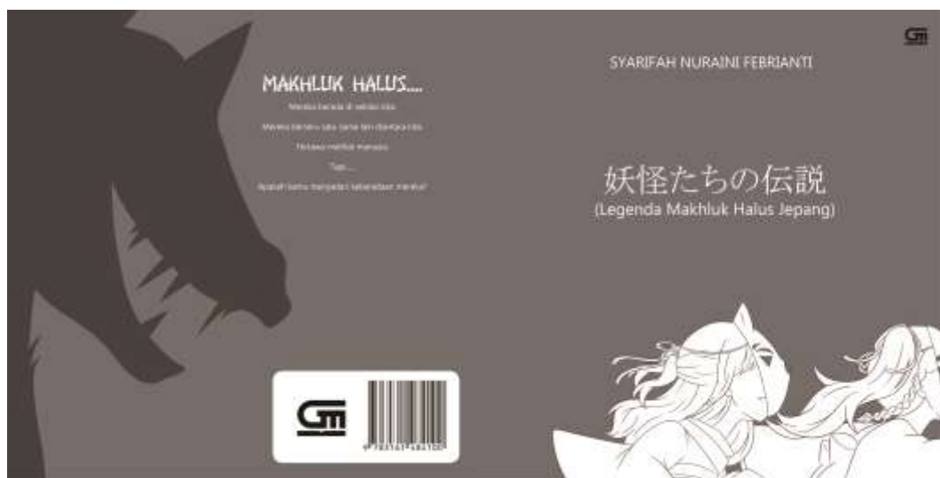
Gambar IV.1.1 Cover Buku Ensiklopedia Makhluk Halus Jepang

Dalam proses pembuatan buku ensiklopedia, beberapa tahapan harus dilakukan, salah satunya adalah mencari referensi mengenai buku-buku ensiklopedia yang sudah ada. Adapun tahapan lainnya seperti mencari referensi gaya visual dan bentuk buku. Untuk media utama, buku ensiklopedia akan memiliki ukuran 20cm x 20cm, dicetak dengan menggunakan teknik offset dengan kertas artpaper 150gr dan menggunakan hardcover sebagai cover depan dan belakang.