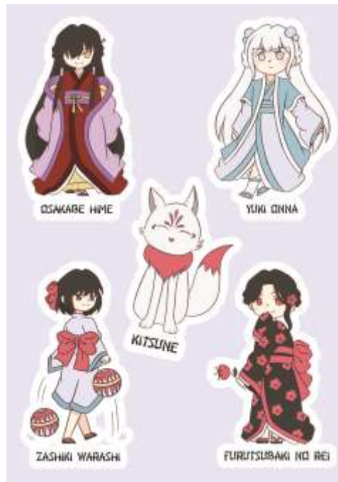
Gambar IV.2.4 Stiker