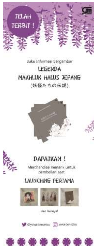
Gambar IV.2.11 X-Banner