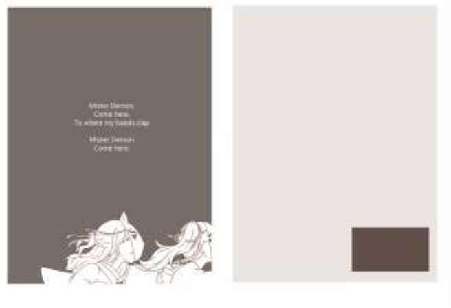
Gambar IV.2.5 Postcard