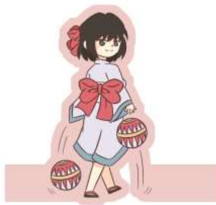
Gambar IV.2.7 Paper Standee