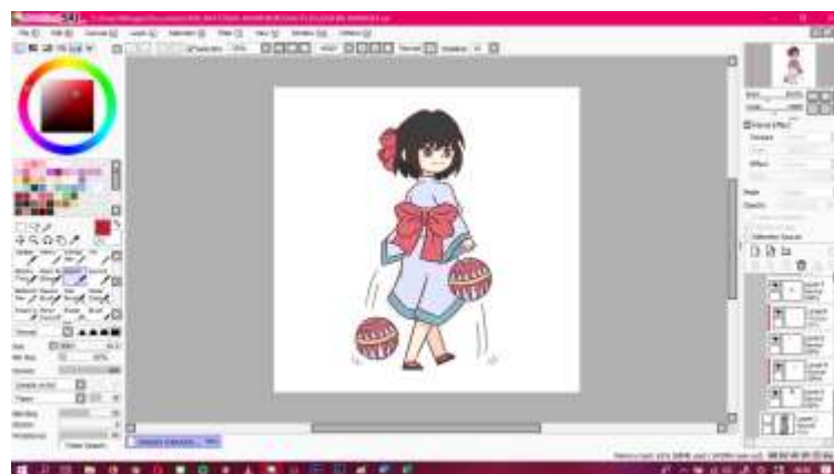
Gambar IV.1.5 Pewarnaan Untuk Karakter Zashiki Warashi

Setelah proses membuat lineart selesai, proses yang selanjutnya dilakukan adalah melakukan proses pewarnaan. Teknik pewarnaan yang dilakukan adalah flat color dan cell shade untuk shading di beberapa bagian. Proses pewarnaan sendiri dilakukan menggunakan aplikasi yang sama seperti proses membuat lineart , yaitu PainTool SAI.