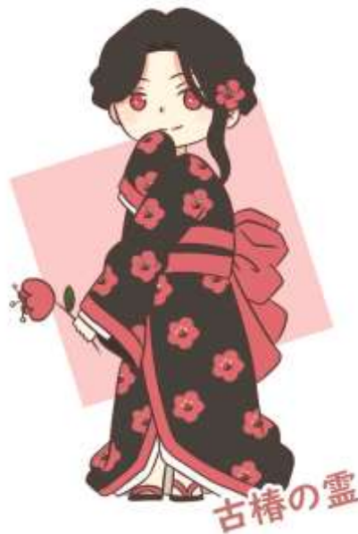
Gambar IV.2.10 Art Print