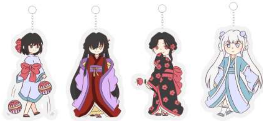
Gambar IV.2.1 Gantungan