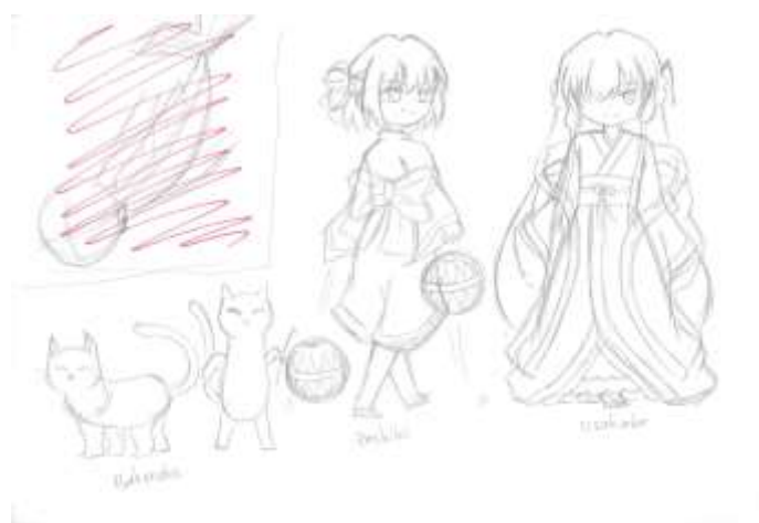
Gambar IV.1.3 Sketsa Beberapa Karakter Makhluk Halus Jepang

Tahap yang paling pertama dilakukan pada proses perancangan buku ensiklopedia ini adalah dengan membuat sketsa dari karakter makhluk halus Jepang yang ada. Sketsa dilakukan dengan dua cara, yaitu dengan cara manual atau digital secara langsung.