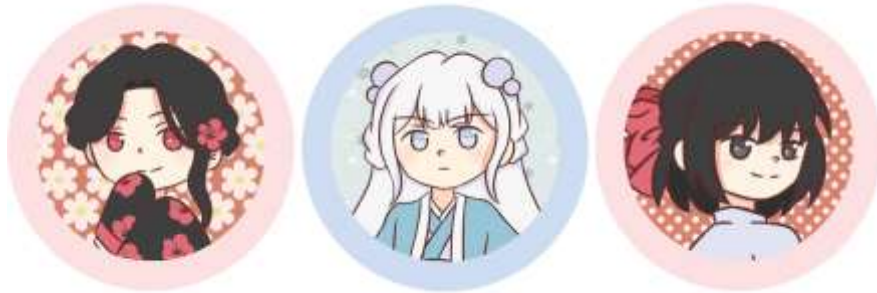
Gambar IV.2.2 Pin