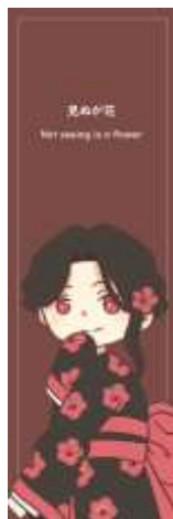
Gambar IV.2.9 Pembatas Buku