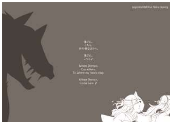
Gambar IV.2.6 Poster