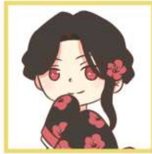
Gambar IV.2.8 Shikishi