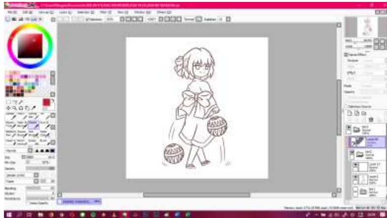
Gambar IV.1.4 Lineart Untuk Karakter Zashiki Warashi

Yang selanjutnya setelah membuat sketsa adalah memindai sketsa untuk dipindahkan pada laptop. Setelah sukses dipindahkan, dilakukan proses membuat lineart dengan cara melakukan tracing garis sketsa. Proses lineart dilakukan menggunakan aplikasi PainTool SAI.