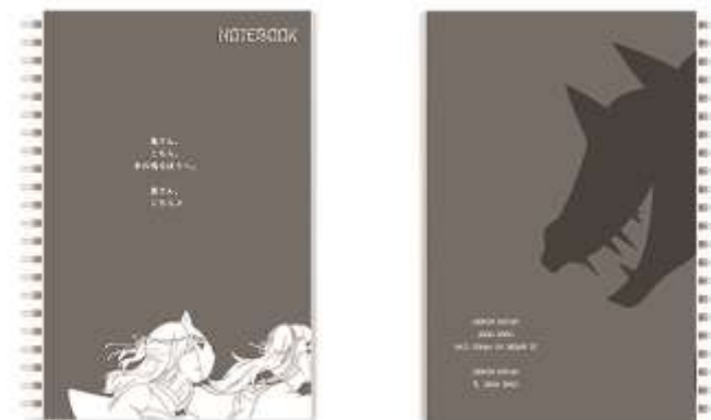
Gambar IV.2.3 Notebook