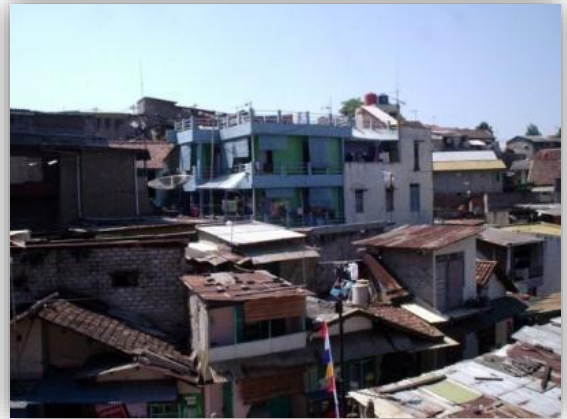
Gambar 3.2 Kondisi Permukiman Padat Kelurahan Lebakgede