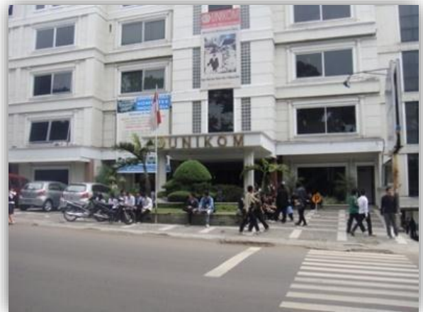
Gambar 3.3 Kondisi Pemanfaatan Lahan Sumber : Hasil Survey, 2019