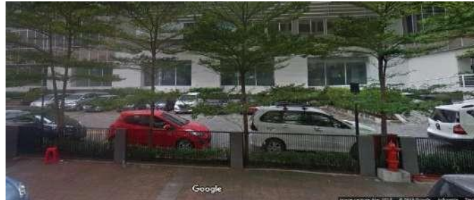
Gambar 2.15 Parkir Jakarta Creative Hub