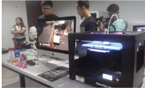
Gambar 2.16 3D Printing