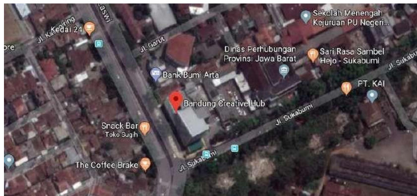
Gambar 2.2 Lokasi dan Lingkungan Sekitar Tapak