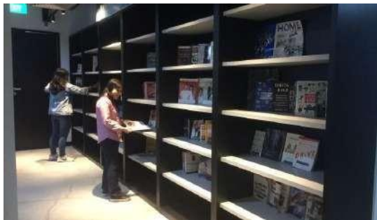
Gambar 2.19 Perpustakaan