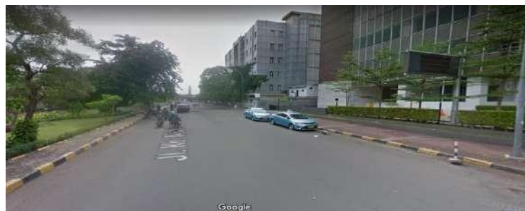
Gambar 2.14 Aksesibilitas