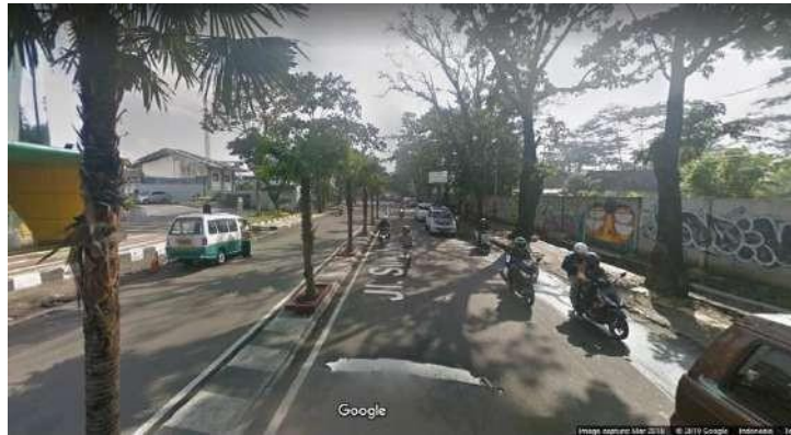
Gambar 2.4 Aksesibilitas Jln. Laswi