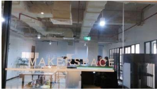
Gambar 2.18 R. Maker Space