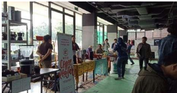
Gambar 2.7 R. Pameran