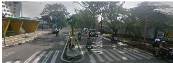
Gambar 2.11 View