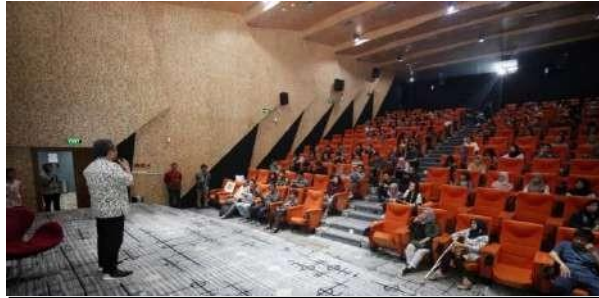
Gambar 2.8 R. Auditorium