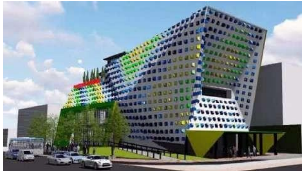
Gambar 2.10 Fasad Bangunan