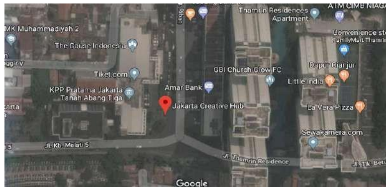
Gambar 2.12 Lokasi dan Lingkungan Sekitar Tapak