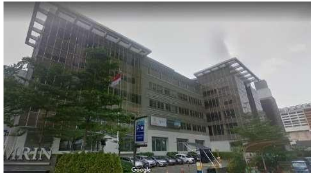
Gambar 2.20 Fasad Bangunan