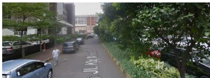
Gambar 2.21 View