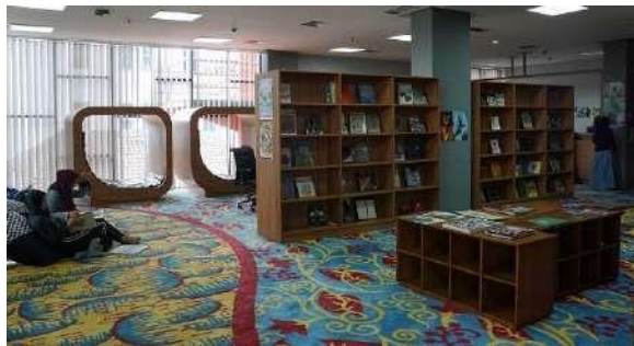
Gambar 2.9 Perpustakaan