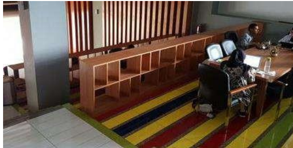
Gambar 2.6 co working umum