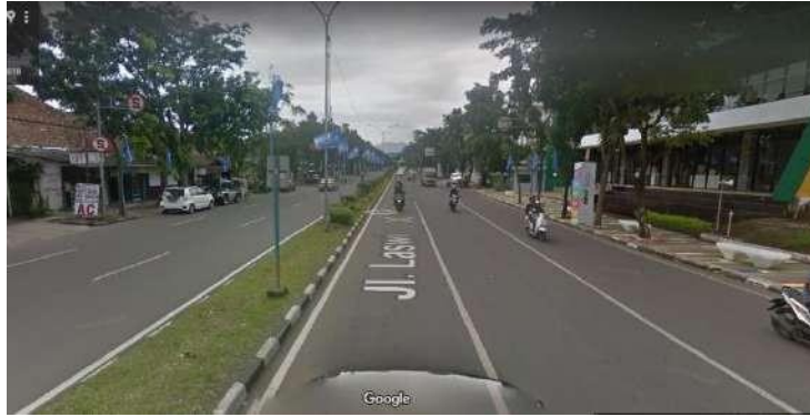
Gambar 2.3 Aksesibilitas Jln. Laswi