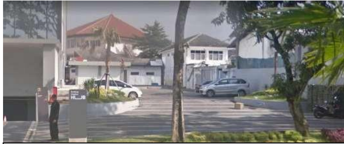
Gambar 2.5 Parkir Bandung Creative Hub