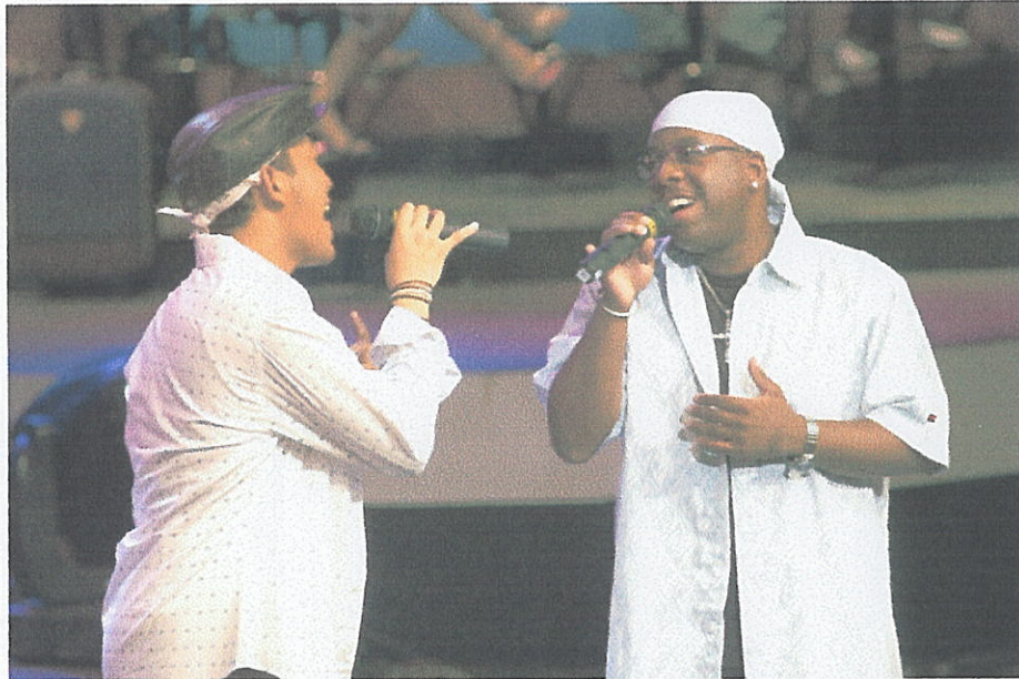
Konser Eliminasi AFI-3 dengan Bintang Tamu Keith Martin di Theater Tanah Airku TMII Jakarta