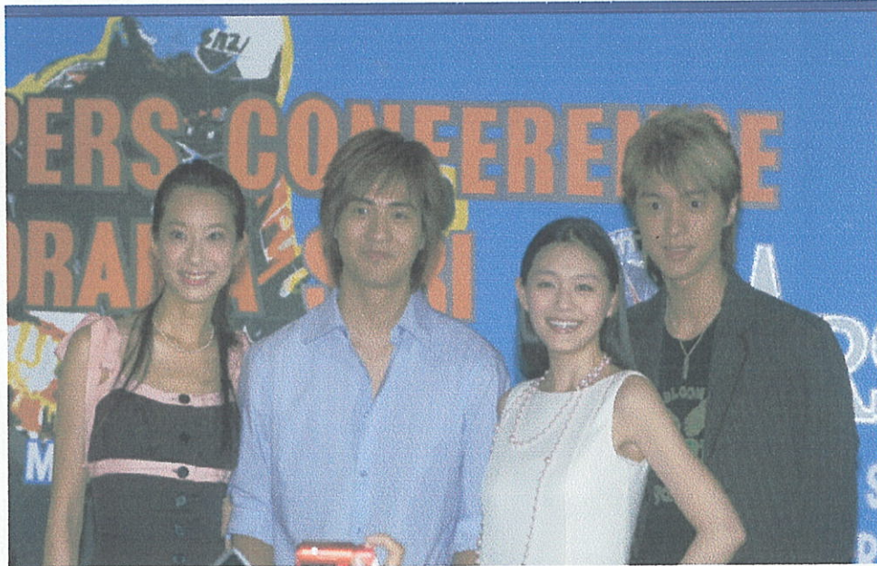
Foto Pers Conference Film Mars yang ditayangkan Indosiar