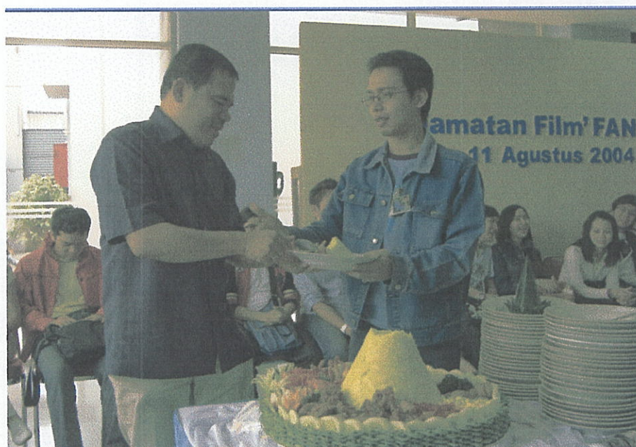
Foto Selamatan Film Fantasi bersama Sutradara Garin Nugroho