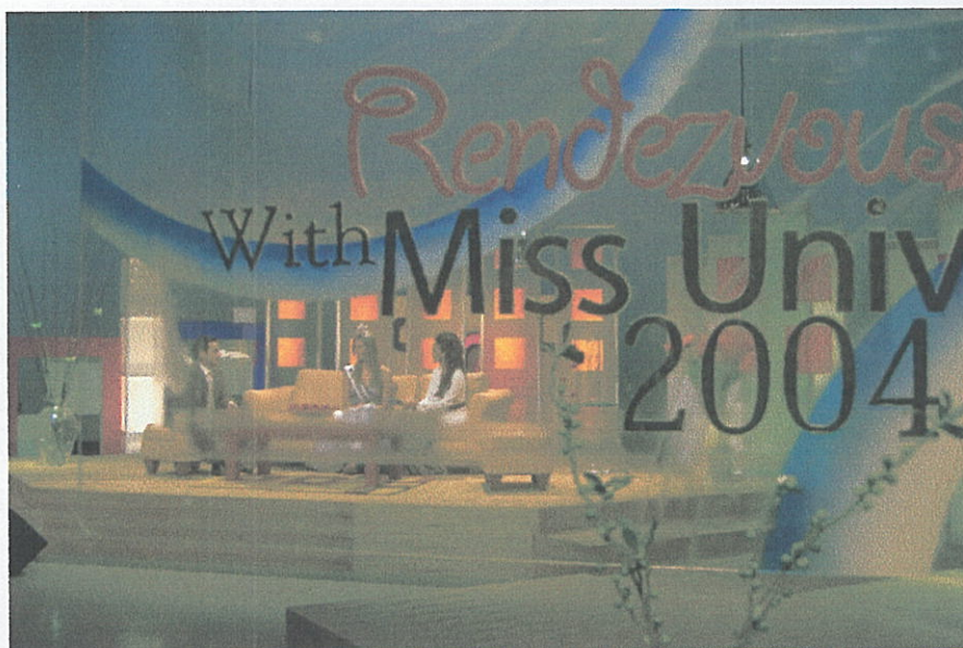
Suasana Setting Studio 3 Indosiar saat Syuting Acara Rendezvous with Miss Universe 2004