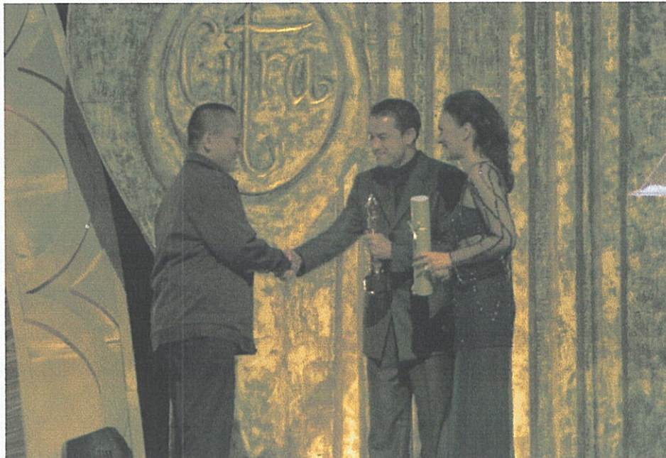
Foto Malam Penganugrahan Citra Pariwara yang ditayangkan Indosiar