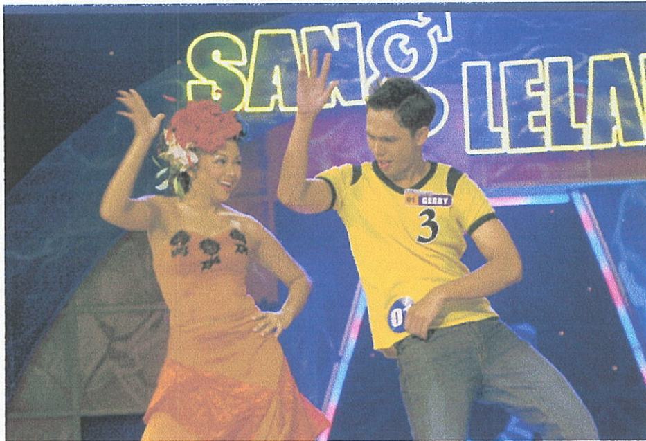
Foto Tayangan Program Acara Sang Lelaki