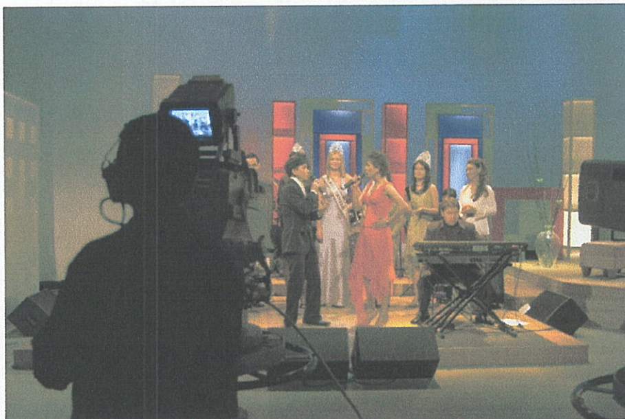
Gambar Proses Syuting Rendezvous with Miss Universe 2004