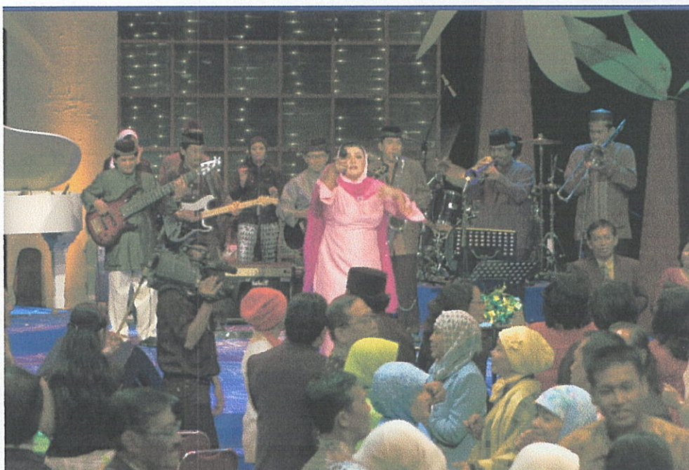
Foto Tayangan Program Acara Tembang Kenangan