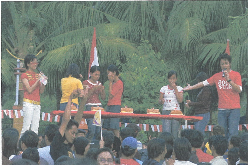
Foto acara Pesta pada saat perayaan HUT Kemerdekaan RI 2004