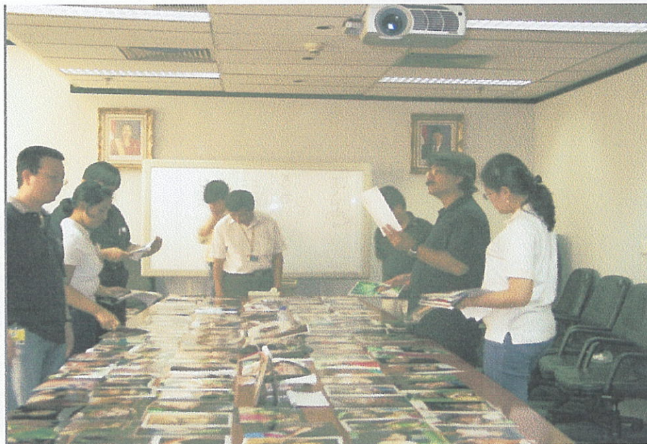
Suasana pada saat Penjurian Lomba Foto 18 Indonesian Model Indosiar