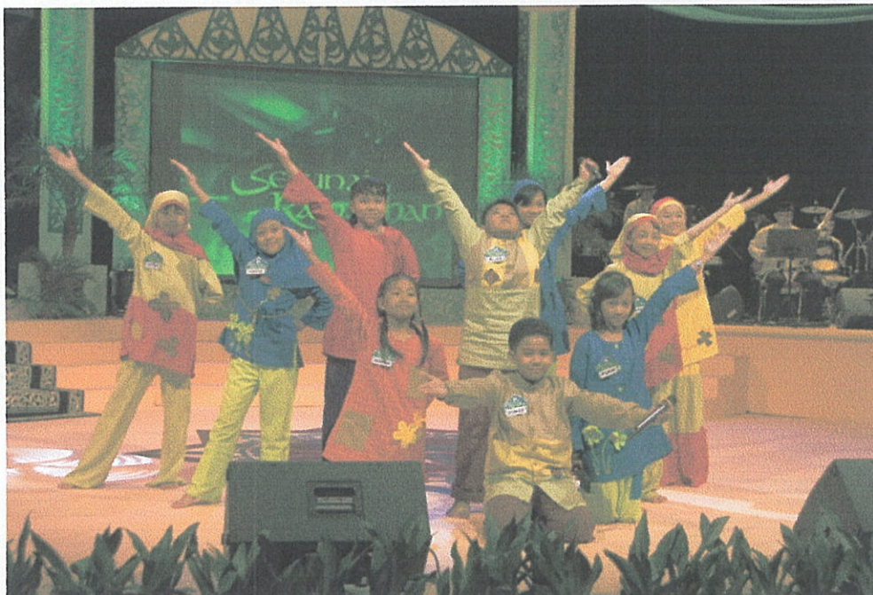
Foto pada saat acara Serunai Ramadhan Indosiar 2004