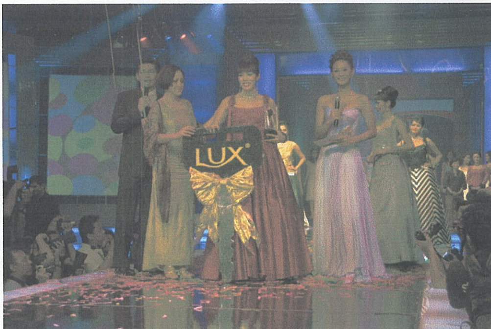
Malam Grand Final Indonesian Model Di JHCC Jakarta 2004