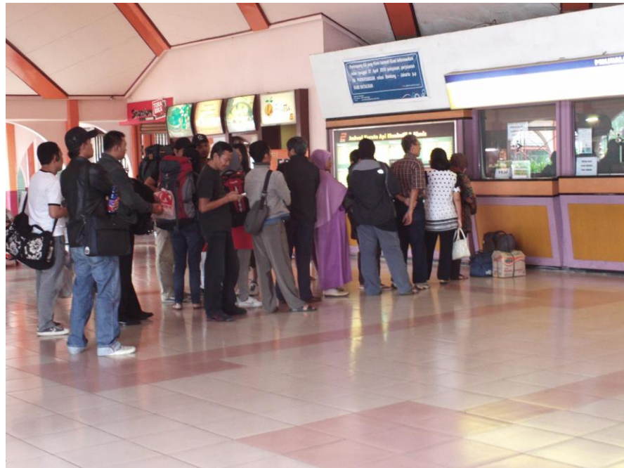
Foto para calon penumpang kereta api di stasiun Kereta Api Bandung menjelang liburan panjang dijadikan untuk berita pertama pkl