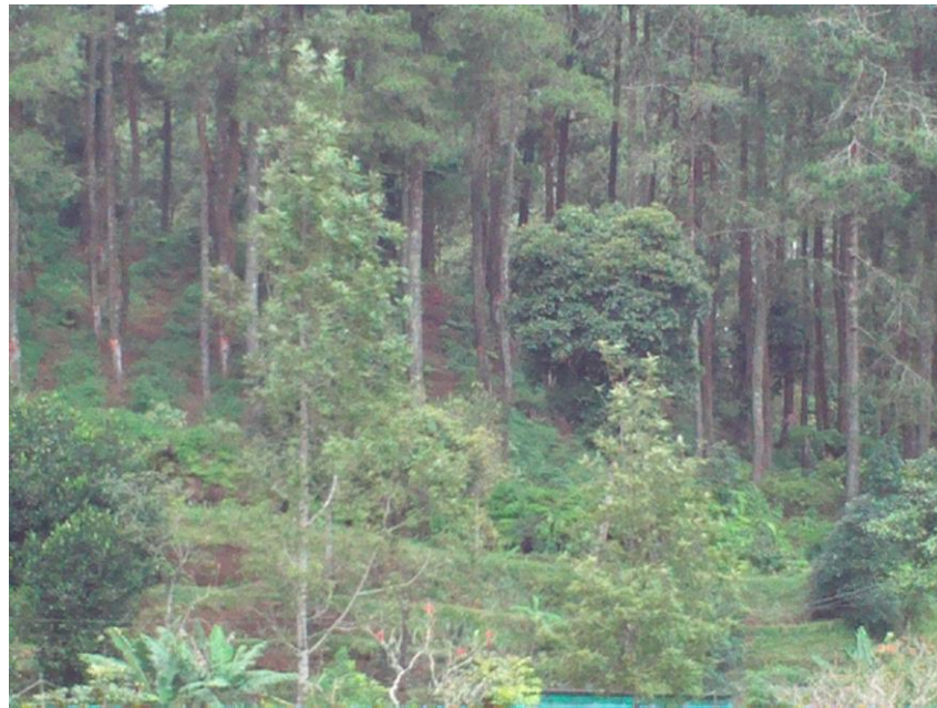
Foto hutan pinus dijadikan dokumentasi untuk tugas display foto dan video yang bertemakan Forest City dan Budaya Jawa Barat