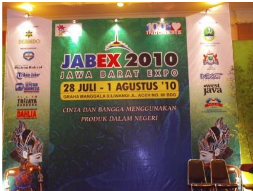
Foto penyelenggaraan JaBar Expo di Graha Manggala Siliwangi Bandung 28 Juli- 1 Agustus 2010