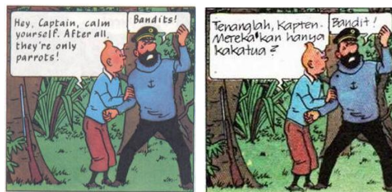
Gambar 4. Sumpah Serapah yang Menunjukkan Perasaan Negatif

Berikut ini pemaparan ilustrasi data yang dianalisis berdasarkan teknik pengumpulan dan analisis data: