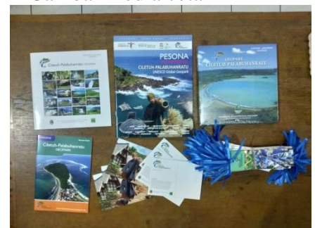
Gambar 4.8 Gambar media cetak

Berikut merupakan contoh dari beberapa media yang digunakan oleh bagian perencanaan dan destinasi dalam pemberian informasi mengenai objek wisata Ciletuh Pelabuhan Ratu Unesco Global Geopark Sukabumi kepada masyarakat Jawa Barat dapat dilihat dari gambar sebagai berikut :