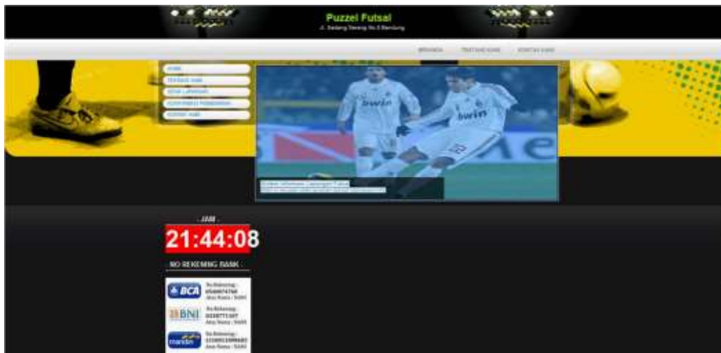
Gambar 4 Halaman Utama Konsumen