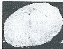
Gb 5.1.6 Menu Mulai