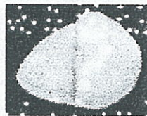
Gb 5.1.3 Menu Cara Menggunakan