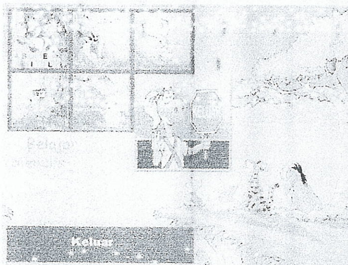
Gb 5.1.1 Menu Utama