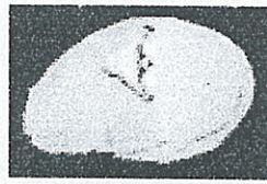
Gb 5.1.5 Menu Mengulang Bunyi

itu user bebas mengklik huruf yang lain dan tidak harus konsonan terlebih dahulu.