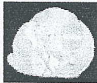
Gb 5.1.4 Menu Keluar