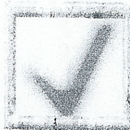
Gb 5.1.7 Form Dialog Benar