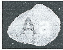
Gb 5.1.2 Menu Mengubah Huruf