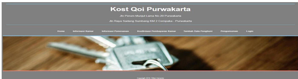
Gambar 3. Halaman Index