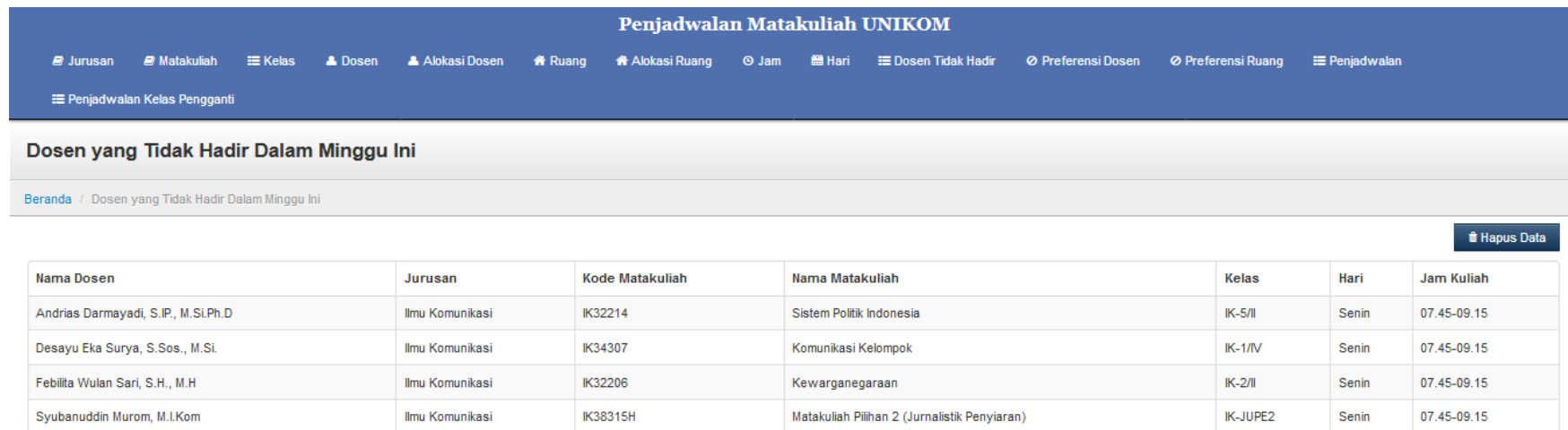
Gambar 4.3 Input Kasus 1b