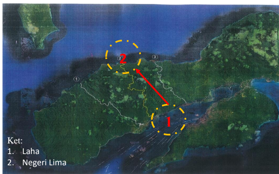
Gambar 3.1 Peta Letak Lokasi Penelitian